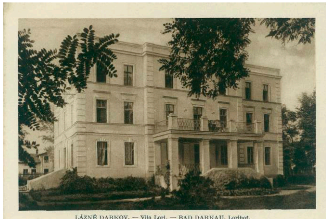
LÁZEŇ DARKOV. — Vila Lori. — BAD DARKAU. Lorihof.

Lázně Darkov mají dlouhou a fascinující historii, která sahá až do 19. století. Od svého založení se lázně vyvinuly z malého léčebného místa v moderní zařízení, které dnes nabízí širokou škálu procedur pro zlepšení zdraví a pohody.