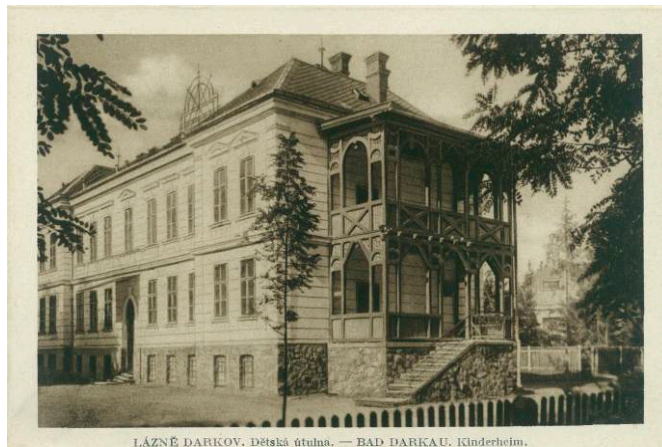
LÁZEŇ DARKOV. Dětská útulna. — BAD DARKAU. Kilderheim.

Jedním z nejzajímavějších historických faktů je, že v 19. století byla léčba v Lázních Darkov zaměřena především na využívání přírodních léčivých pramenů. Voda bohatá na minerály byla považována za účinnou při léčbě různých onemocnění, zejména těch, které se týkaly trávicího ústrojí a metabolismu. S rozvojem vědy a medicíny se léčba začala doplňovat o další metody, jako je například fyzioterapie a masáže.